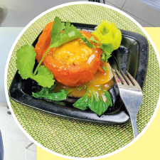
精緻、美麗的紅袍獅子球呈現眼前