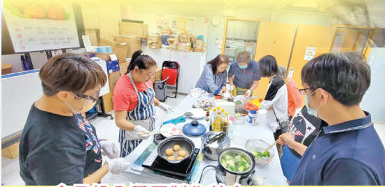
會員投入學習製作美食