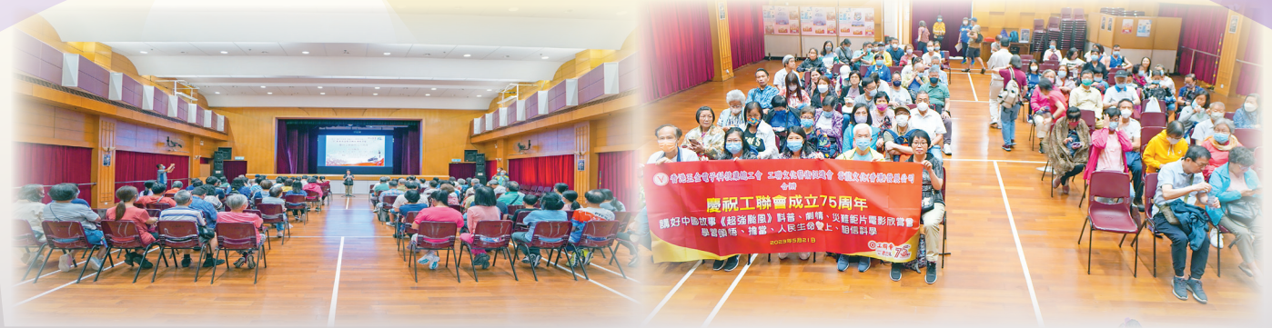
會員觀後感：體會到相信科學、人民生命至上的重要

會員與家屬於2023年5月21日在工聯會工人俱樂部免費觀看中國首部科學災難電影《超強颱風》