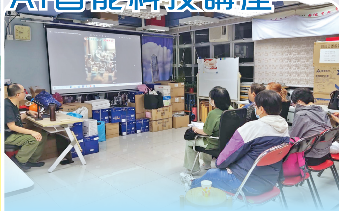
學員對導師講解的「AI智能科技」知識感到歎為觀止