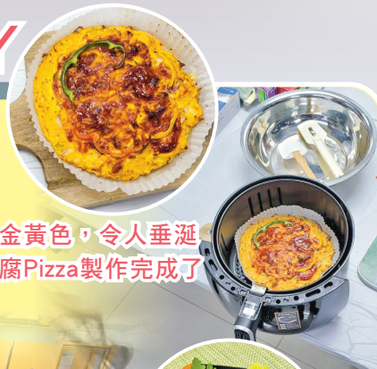
香噴噴、金黃色，令人垂涎三尺的豆腐Pizza製作完成了