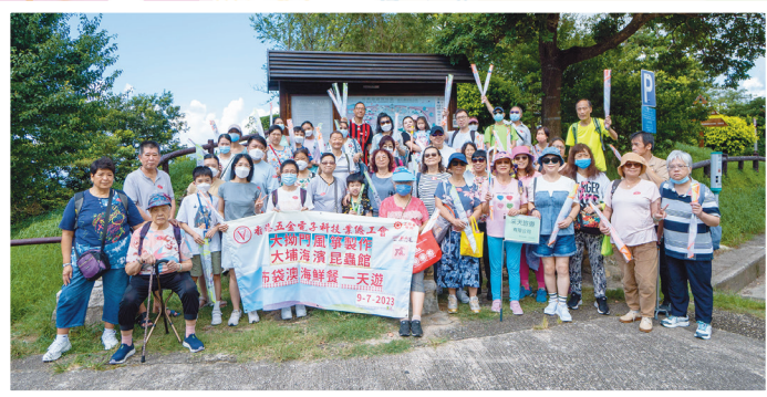
大家手上拎著風箏在大坳門郊野公園拍照留念