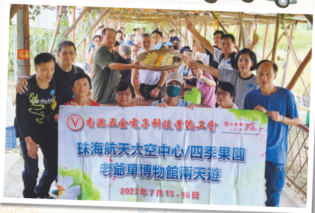
我們品嚐了不同種類的新鮮果園水果