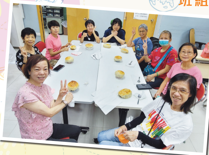
美食班 - 酥皮海皇羹製作完成，香味四溢，真令人垂涎三尺。Yeah！