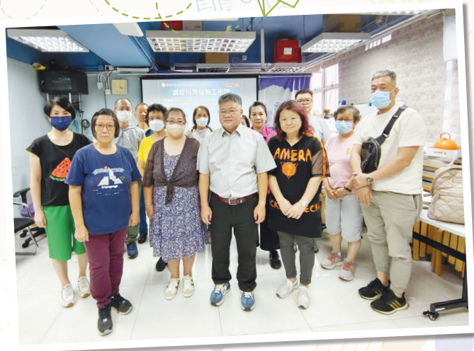
「減壓自我催眠工作坊」結束，多謝兩位講者（前右三及四）