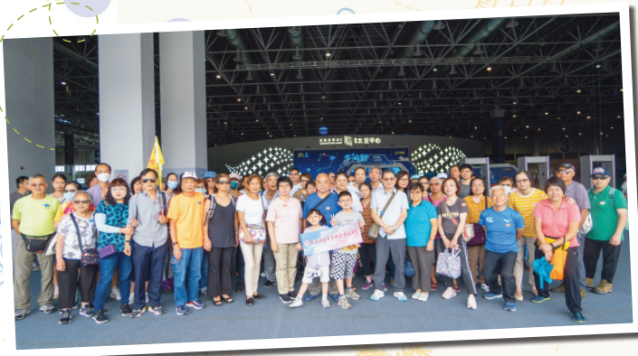
團友在珠海航天太空中心拍照留念